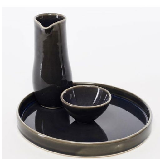
Botella φ 6 cm H 19 cm Bol φ 9 cm H 6 cm Plato φ 24 cm H 3 cm